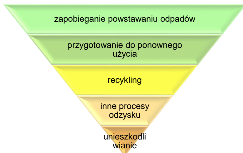
Rysunek 1 Hierarchia postępowania z odpadami

Powyżej [rys. 1] przedstawiono hierarchię postępowania z odpadami wg art. 4 Dyrektywy 2008/98/WE, która dotyczy postępowania i gospodarowania odpadami. Należy dążyć w pierwszej kolejności do zapobiegania powstawaniu odpadów.