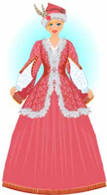
Strój szlachecki kobiecy