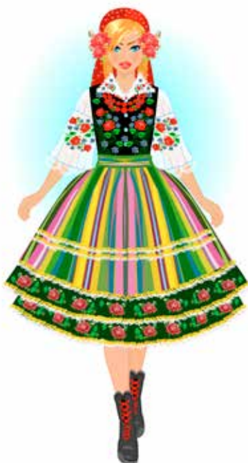
Strój łowicki kobiecy