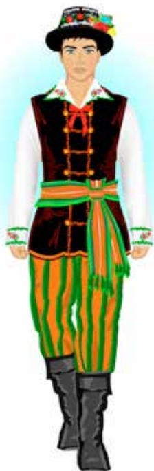
Strój łowicki męski