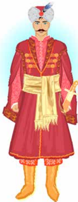
Strój szlachecki męski