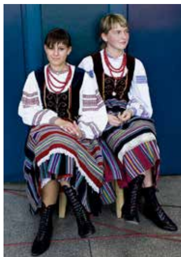
Ludowy strój podlaski nadbużański