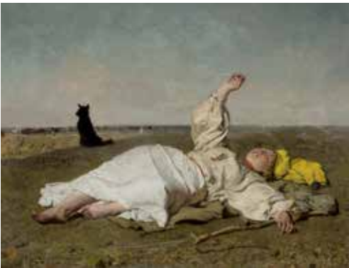
Józef Chełmoński, Babie lato