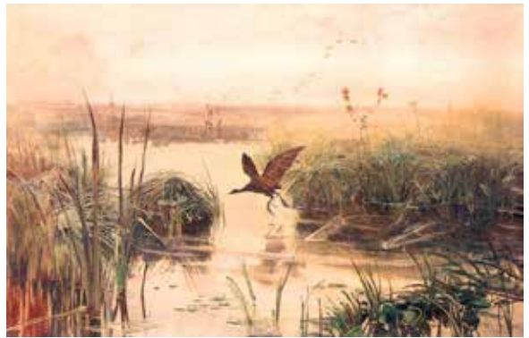
Józef Chełmoński, Kurka wodna