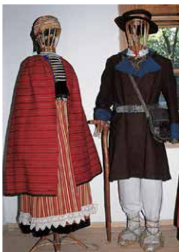
Ludowy strój kurpiowski Puszczy Zielonej