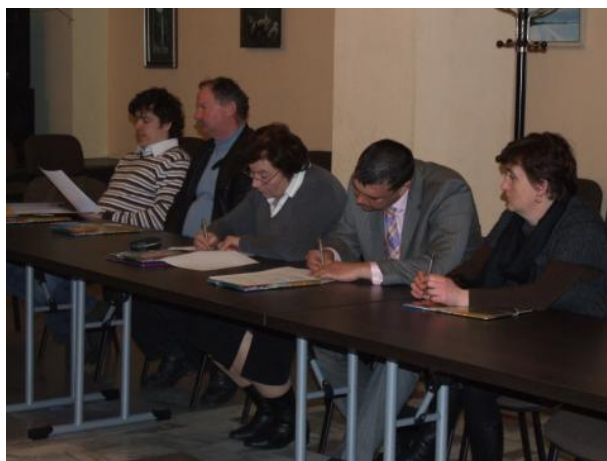
Fot. Spotkanie aktywizacyjne w GCKiS w Jabłonie, 01.02.2011r. (na fot. członkowie Komitetu LGR reprezentujący sektor rybacki)