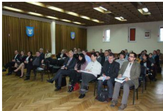
WZC "Lokalnej Grupy Rybackiej Zalew Zegrzyński", dn. 08.02.2011r. Na fot. Członkowie LGR.

Opracowana w powyżej opisany sposób Lokalna Strategia Rozwoju Obszaru Rybackiego „Lokalnej Grupy Rybackiej Zalew Zegrzyński” będzie dobrze służyć możliwemu do zrealizowania procesowi rozwoju sektora rybackiego na obszarze. Zostało to zapewnione poprzez: