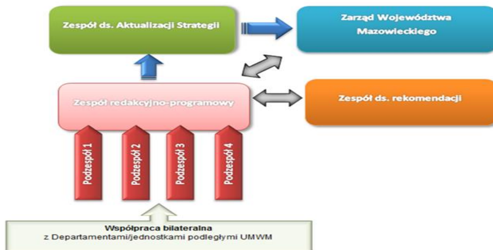
Rysunek 1. Schemat współpracy w ramach zespołów zadaniowych.

Wypracowany w podzespołach kształt Programu każdorazowo przekazywany został do uzgodnienia na ogólnym posiedzeniu Zespołu redakcyjno-programowego. Następnie ostateczne stanowisko przekazywano pod obrady Zespołu ds. Aktualizacji Strategii. Po uzyskaniu pozytywnego stanowiska, dokument był przekazywany na posiedzenie Zarządu Województwa Mazowieckiego.