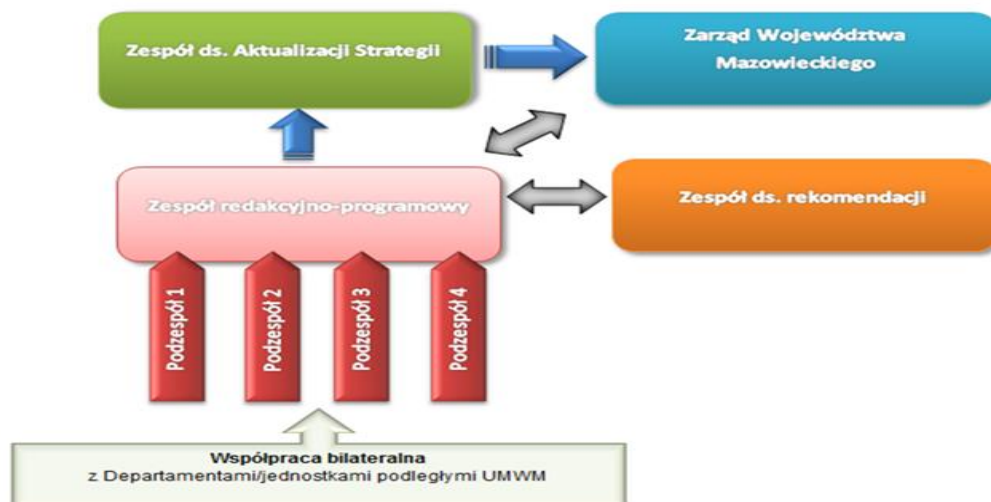
Rysunek 1. Schemat współpracy w ramach zespołów zadaniowych.

Wypracowany w podzespołach kształt Programu każdorazowo przekazywany został do uzgodnienia na ogólnym posiedzeniu Zespołu redakcyjno-programowego. Następnie ostateczne stanowisko przekazywano pod obrady Zespołu ds. Aktualizacji Strategii. Po uzyskaniu pozytywnego stanowiska, dokument był przekazywany na posiedzenie Zarządu Województwa Mazowieckiego.