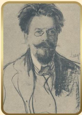
Portret Reymonta Leona Wyczółkowskiego