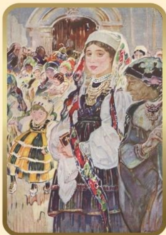
Litografia z „Chłopów” Apoloniusza Kędzierskiego