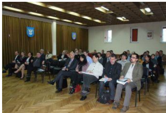
WZC "Lokalne Grupy Rybackiej Zalew Zegrzyński", dn. 08.02.2011r. Na fot. Członkowie LGR.

Opracowana w powyżej opisany sposób Lokalna Strategia Rozwoju Obszaru Rybackiego „Lokalne Grupy Rybackiej Zalew Zegrzyński” będzie dobrze służyć możliwemu do zrealizowania procesowi rozwoju sektora rybackiego na obszarze. Zostało to zapewnione poprzez: