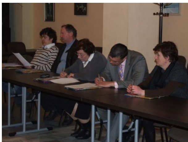
Fot. Spotkanie aktywizacyjne w GCKiS w Jabłonie, 01.02.2011r. (na fot. członkowie Komitetu LGR reprezentujący sektor rybacki)